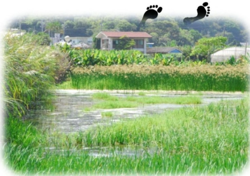
喜如嘉のターブク(田んぼ)