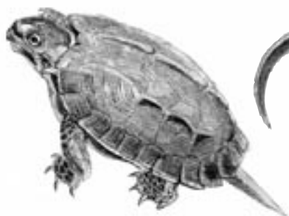
リュウキュウヤマガメ

雨の日には、リュウキュウヤマガメ、イボイモリ、シリケンイモリなどが路上に現れます。路面が雨でぬれて黒くなっているため確認しにくく注意が必要です。